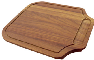
Tabla de corte de madera Iroko 8655 000